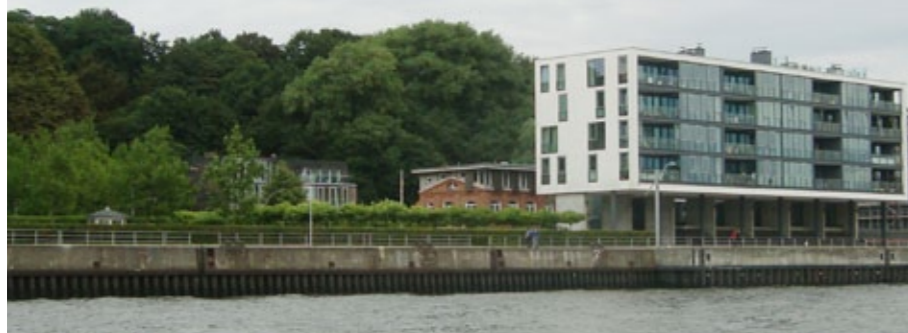
Die Geschäftsstelle des KYCD in Hamburg