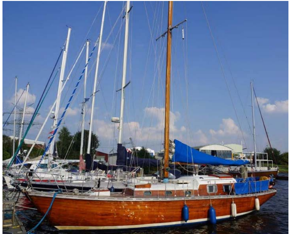
Ein Crewmitglied kam ums Leben – Die BSU empfahl daraufhin eine Rettungswestenpflicht

Die Empfehlungen der BSU sind das Resultat der Untersuchung eines tödlichen Unfalls vor der Hafeneinfahrt von Warnemünde im September 2015. Vier Herren kamen mit einer klassischen Chartersyacht von knapp zwölf Meter Länge bei vier bis fünf Beaufort von Gedser. Nach Erreichen des Seekanals wurde dicht außerhalb des grünen Tonnenstrichs zunächst das Groß geborgen, anschließend sollte die Fock niedergeholt und längs der Reling gezurrt werden. Hierzu war ein erfahrener Segler zum Bug gegangen. Ein anderer, mit bestenfalls geringen Kenntnissen, befand sich weiter mittschiffs, um das Segel vom Schothorn aus für das Zurren glatt zu ziehen, hierfür war er in die Hocke gegangen. Als die Yacht in einer Welle eine heftige Auf- und Abwärtsbewegung machte, wurde er aus seiner unsicheren Arbeitshaltung rückwärts über die Reling geschleudert. Es gelang ihm, sich noch einen Moment an der Reling festzuhalten, dann glitt er ab. Unter Motor wurden eine oder mehrere Wenden gefahren, und es wurde versucht, ihm einen Festmacher zuzuwerfen. Diesen konnte der Verunglückte schließlich greifen und um sich schlingen, diese Leine befand sich noch an seinem Körper, als er Tage später tot geborgen wurde. Die Leine war nutzlos, weil sie an Bord nicht belegt war und auch nicht festgehalten wurde. Mittels eines Rettungskragens mit Leine gelang es dann nicht, zum noch dicht bei der Yacht Treibenden eine Verbindung herzustellen, da die Leine auf Grund der Anbringung ihrer Trommel oder wegen