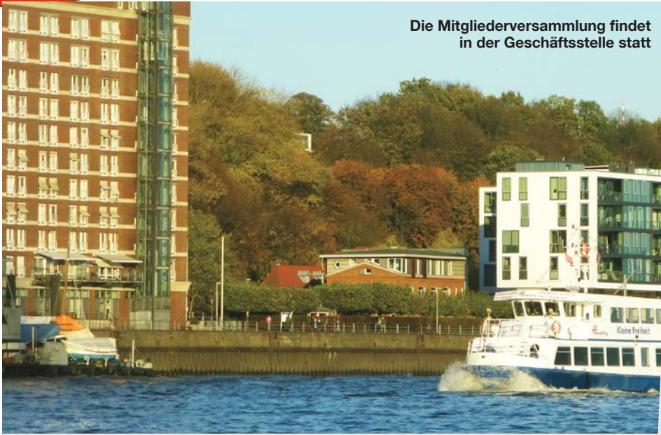
Die Mitgliederversammlung findet in der Geschäftsstelle statt