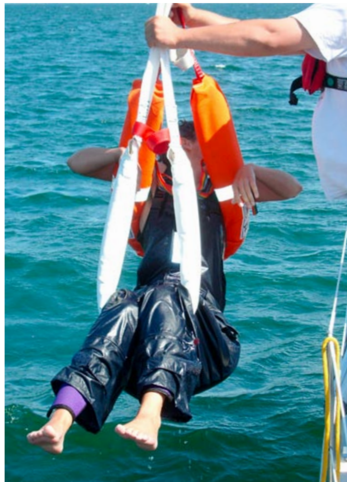
Rettungsmittel gehören an Bord, keine Frage – aber man muss den Einsatz üben, um im Notfall schnell reagieren zu können

Insgesamt stellt der FSR den Skippern ein gutes Zeugnis aus: „Die Skipper nehmen ihre Verantwortung ernst. Es hat sich bewährt, auf Selbstverantwortung statt auf gesetzliche Vorschriften zu setzen.