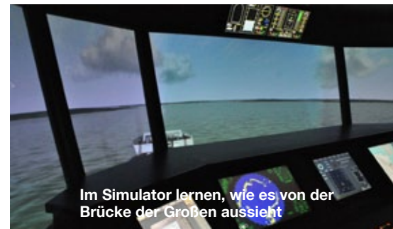
Im Simulator lernen, wie es von der Brücke der Großen aussieht

Kreuzer Yacht Club Deutschland e.V., Neumühlen 21, 22763 Hamburg, Tel. 040/741 341 00, Fax 040/741 341 01, E-Mail: info@kycd.de , Internet: www.kycd.de . Öffnungszeiten der Geschäftsstelle: Mo.-Mi. 09.30 bis 12.00 Uhr, Do. 09.30 bis 15.30 Uhr.