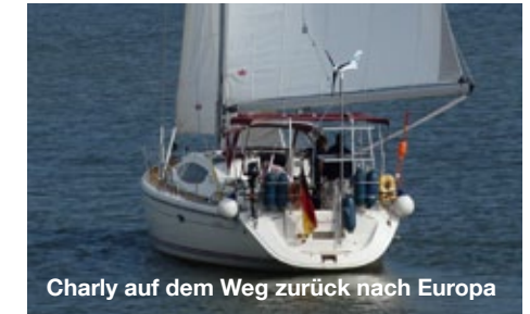
Charly auf dem Weg zurück nach Europa

sind Skipper und Yacht privat auf dem Wege nach Hause. Wo Crew und Yacht gerade sind und was an Bord so passiert, kann aber weiterhin im Internet des KYCD im Online-Logbuch verfolgt werden ( www.kycd.de/charlylogbuch.htm ). Wenn Skipper und Yacht wieder in Cuxhaven angekommen sind, wird es sicherlich viele spannende Berichte geben.