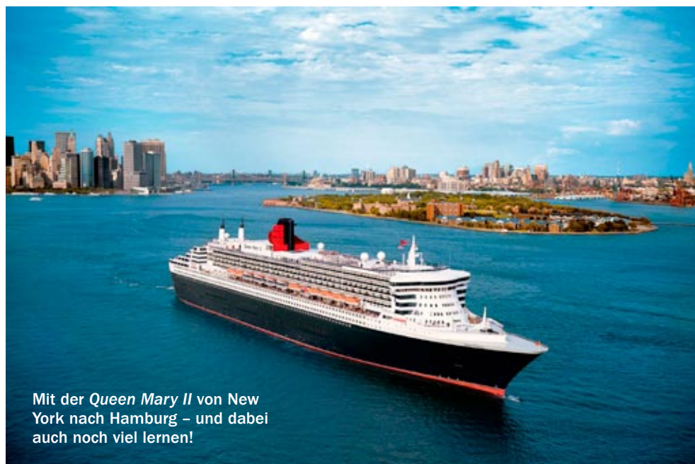
Mit der Queen Mary II von New York nach Hamburg – und dabei auch noch viel lernen!