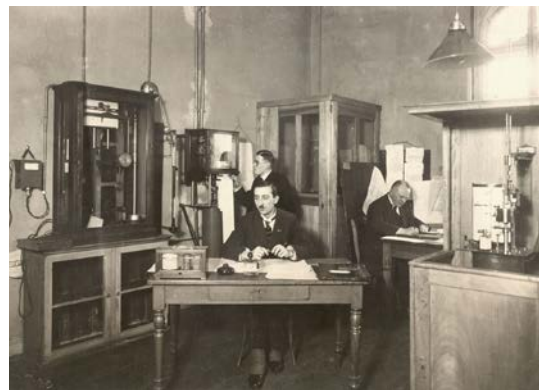
Deutsche Seewarte, Meteorologische Abteilung, circa 1925

Außerdem sind zahlreiche historische Instrumente aus der Anfangszeit Seewarte zu sehen, wie beispielsweise eine Luftwaage und der Sprung'sche Laufgewichtsbarograph, von denen weltweit nur noch wenige Exemplare existieren. Ausgestellt ist auch das meteorologische Journal der Bark „Paula“, von der 1886 zur Erforschung der Meeresströmungen eine Flaschenpost ausgeworfen wurde, die 2018 an der Westküste Australiens auftauchte. (Vgl. Club-Magazin 2/2018)