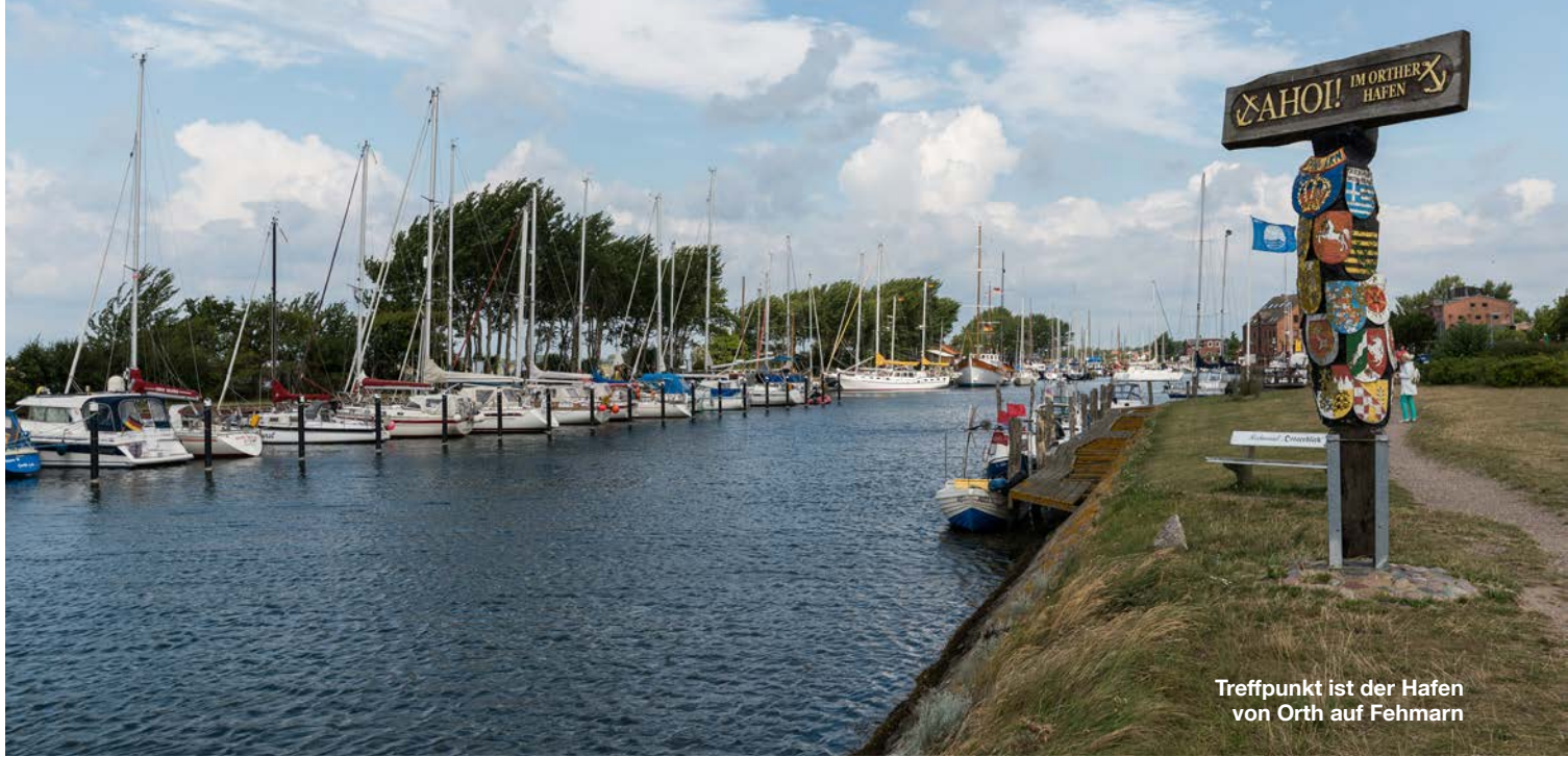
Treffpunkt ist der Hafen von Orth auf Fehmarn