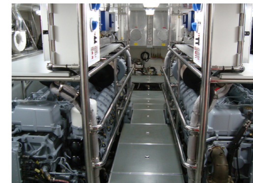
Leider sind nicht alle Bootsmotoren so schön übersichtlich und zugänglich ...